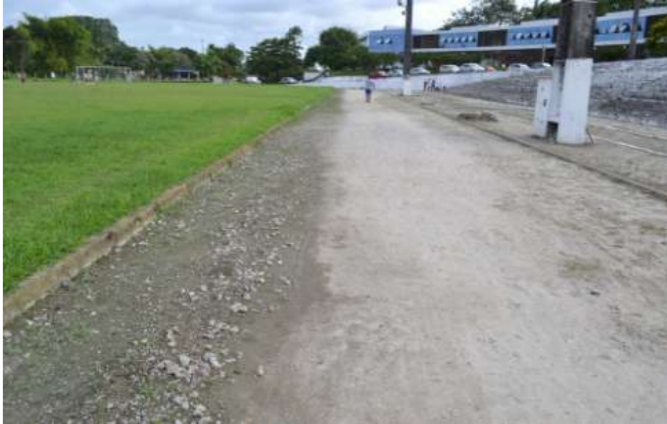
Pista de atletismo utilizada pela comunidade acadêmica e pela comunidade do entorno da UFRPE - Dois Irmãos.