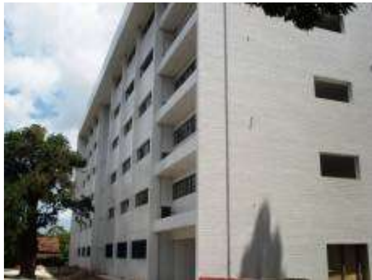
Prédio do CEGEN