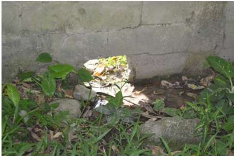
Esgoto do RU