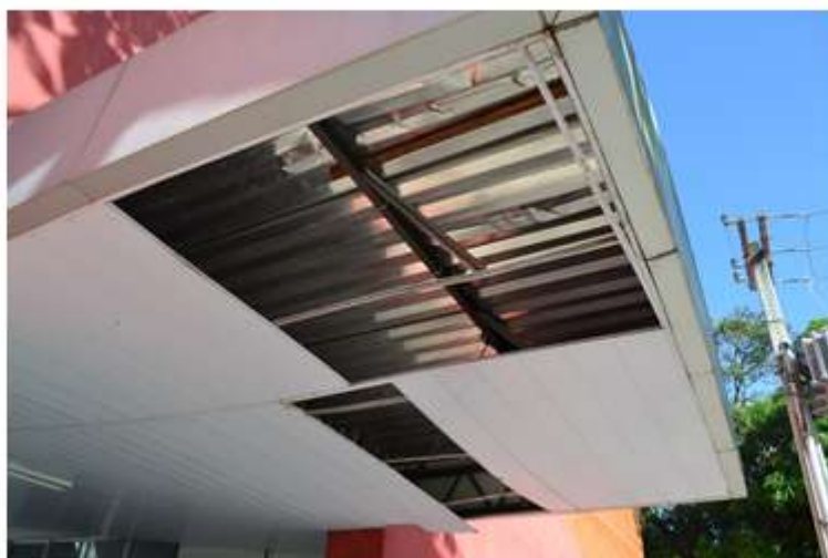
Ginásio - DEF