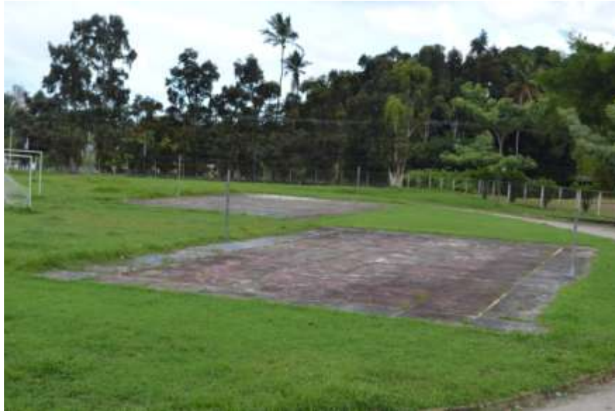
Quadra de Voleibol situada ao lado da piscina/UFRPE