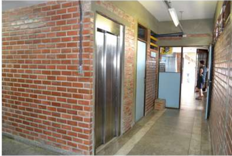
Acessibilidade - CEGOE