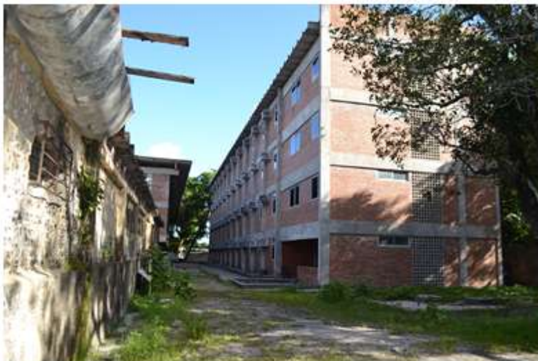
Bloco D – prédio concluído