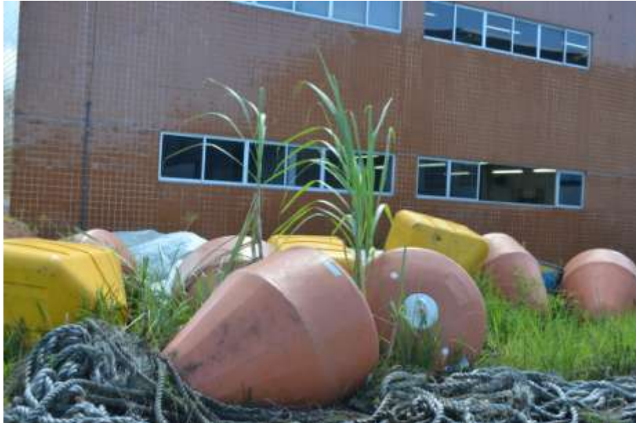
Entorno do DEPAQ/UFRPE