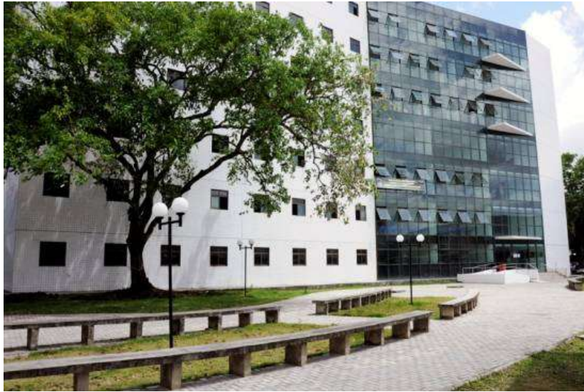
Prédio do Departamento de Biologia