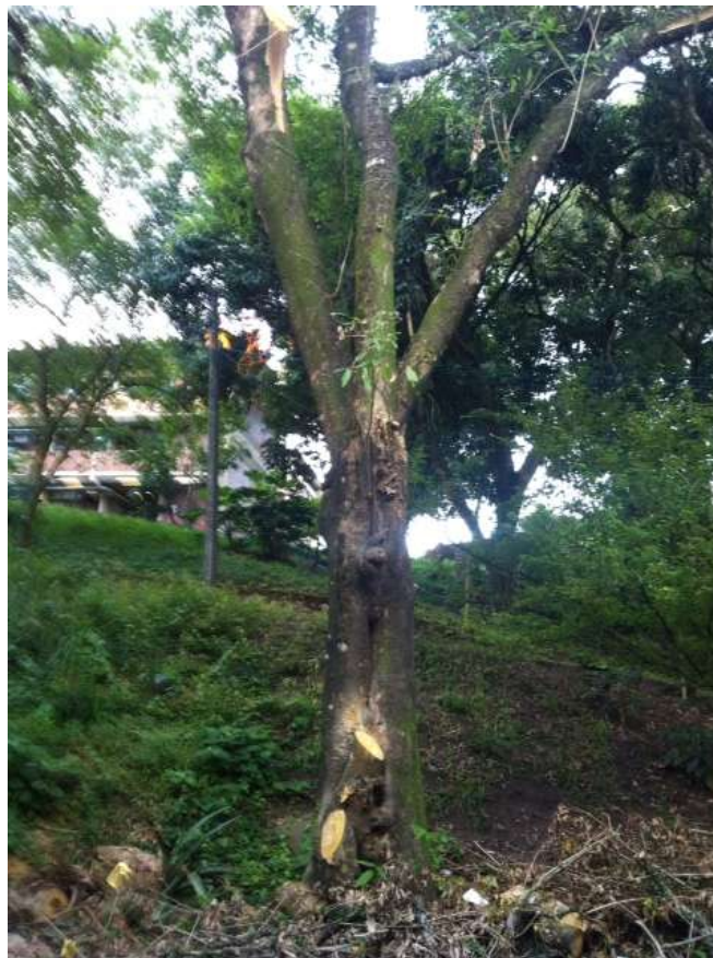
Departamento de Biologia/UFRPE.