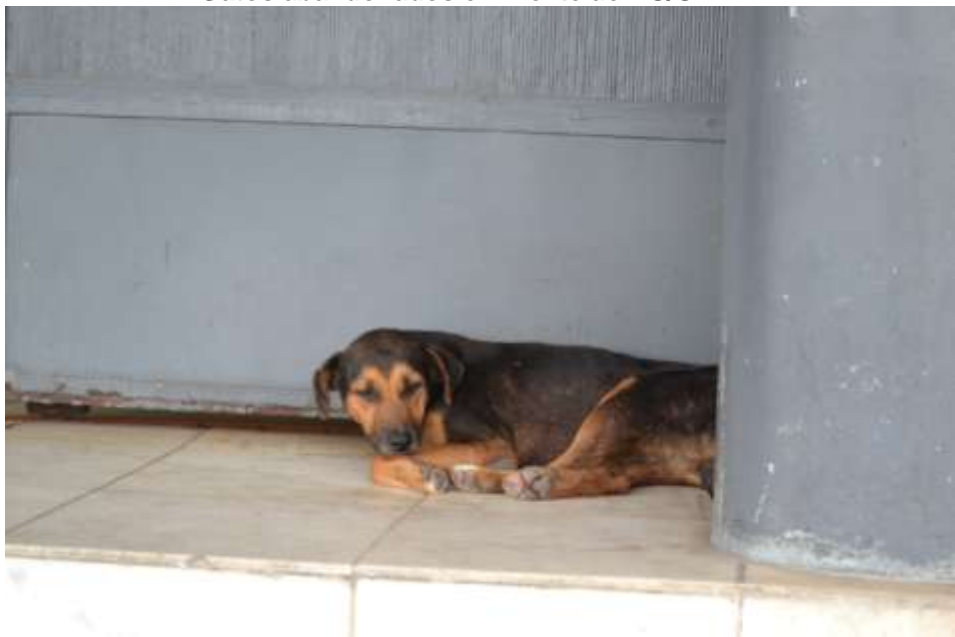
Cães abandonados na UFRPE