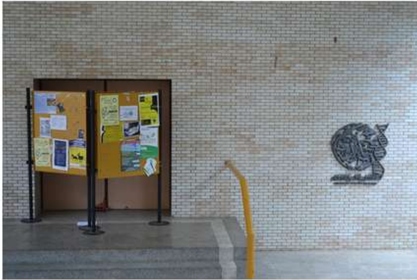
Anfiteatro do CEGOE

Visando aprimorar o cumprimento da transparência na gestão pública, a ADUFERPE solicita à reitoria da UFRPE, além das informações documentadas sobre a previsão de conclusão e entrega destas obras à comunidade acadêmica, as devidas informações sobre o volume de recursos captados para a execução das mesmas, suas fontes e os cronogramas atualizados de desembolso e uso dos mesmos.