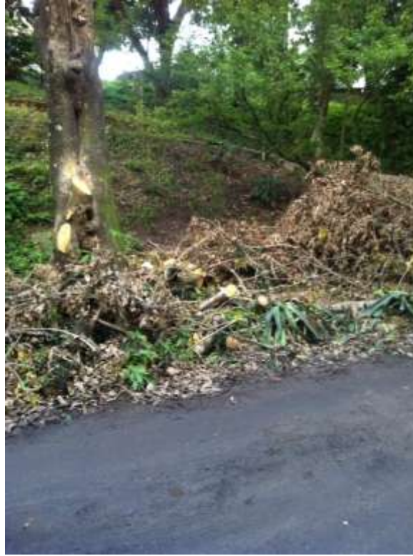
Departamento de Biologia/UFRPE.