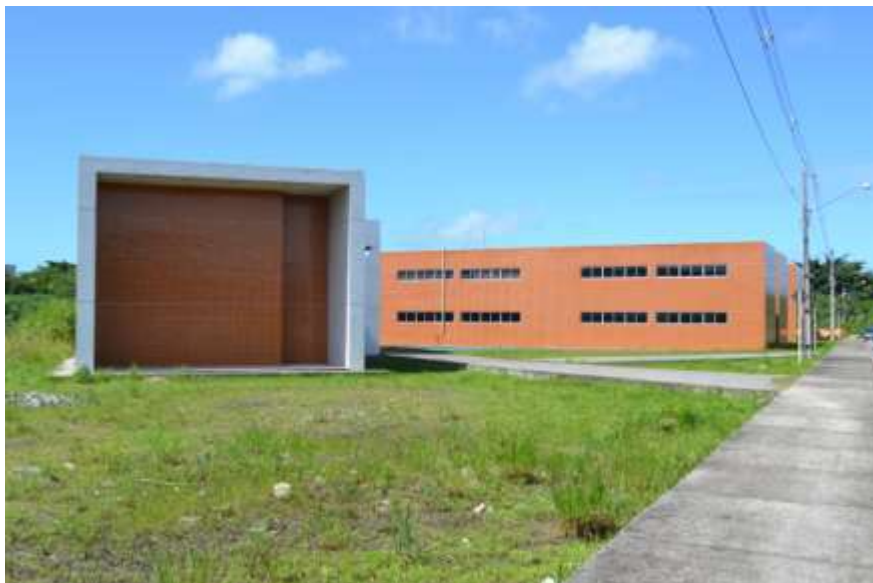
Novo Prédio- DEPAQ/UFRPE