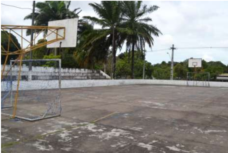
Quadra de esporte descoberta – próxima ao Prédio Central