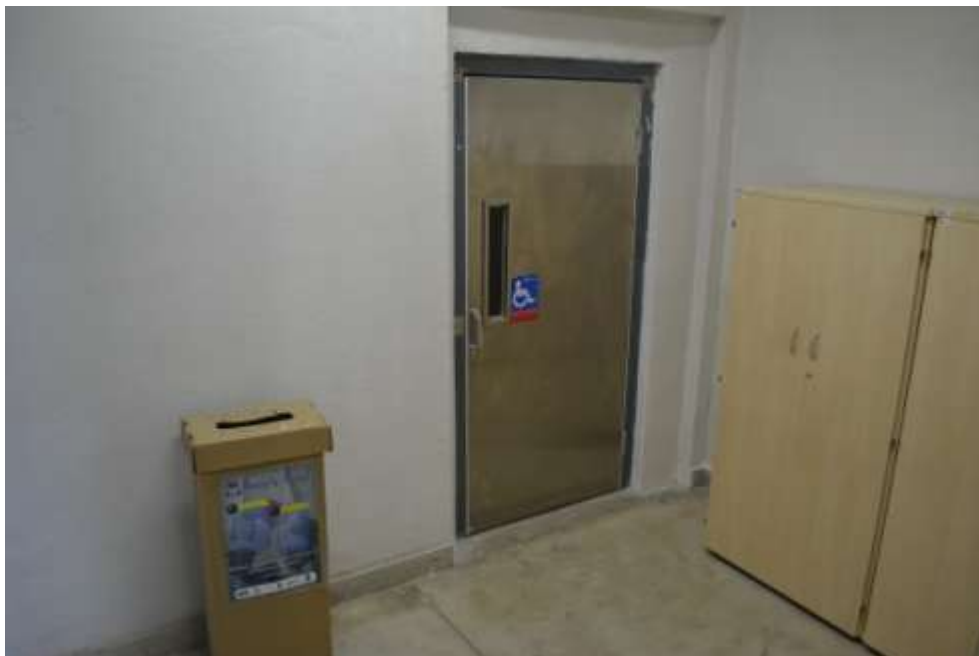
Plataforma de elevação do Departamento de Educação Física