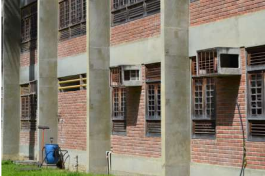
Parte externa do CEGOE – Caixa de ar-condicionado sem aparelho