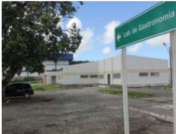
Prédio de Gastronomia