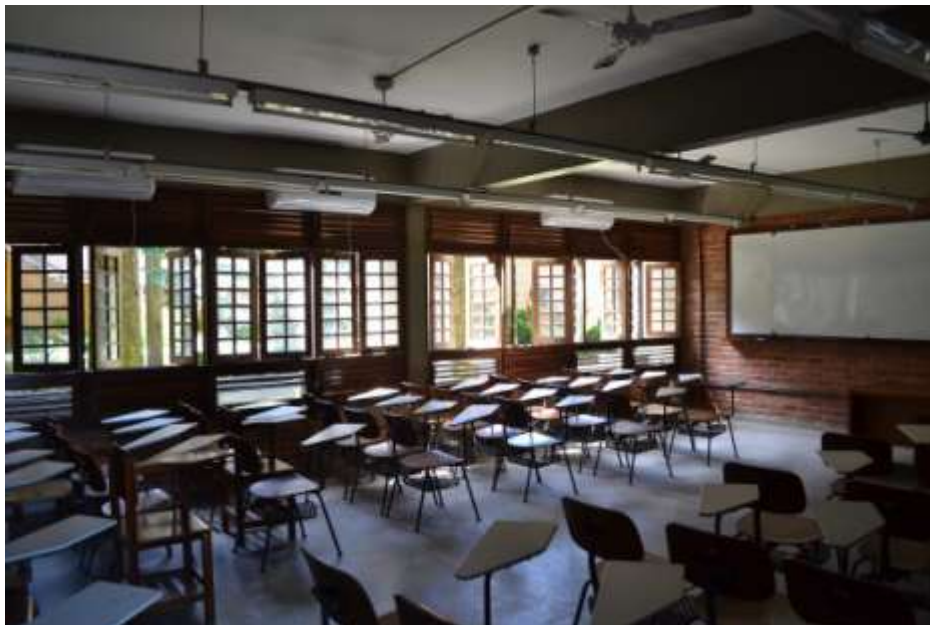
Sala de aula do CEGOE – aparelho instalado sem funcionamento