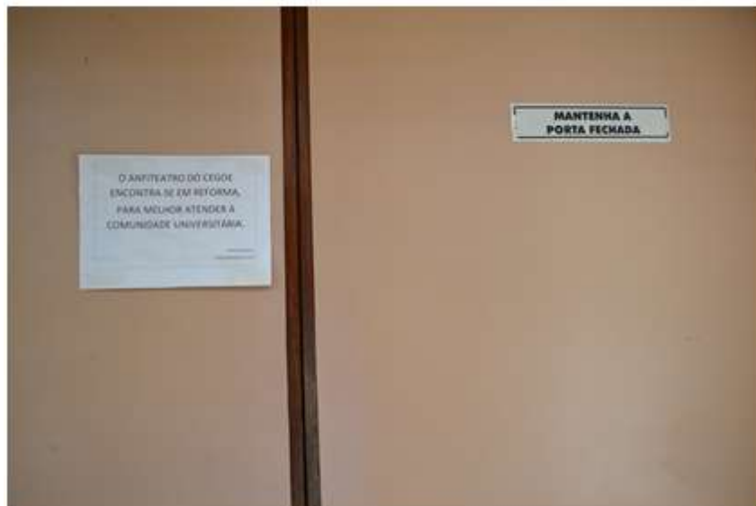
Anfiteatro do CEGOE