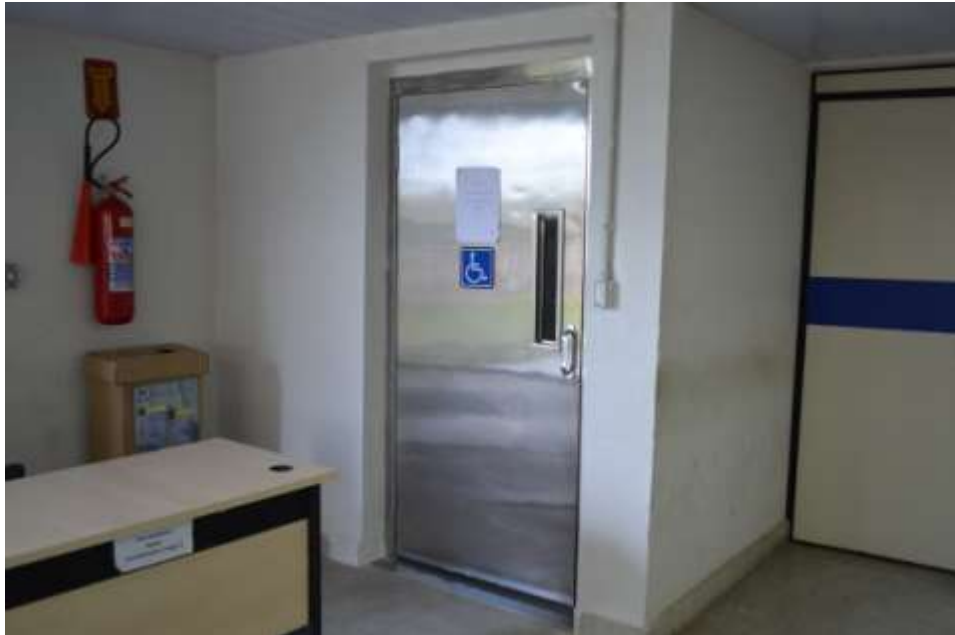
Plataforma de elevação do CEAGRI II