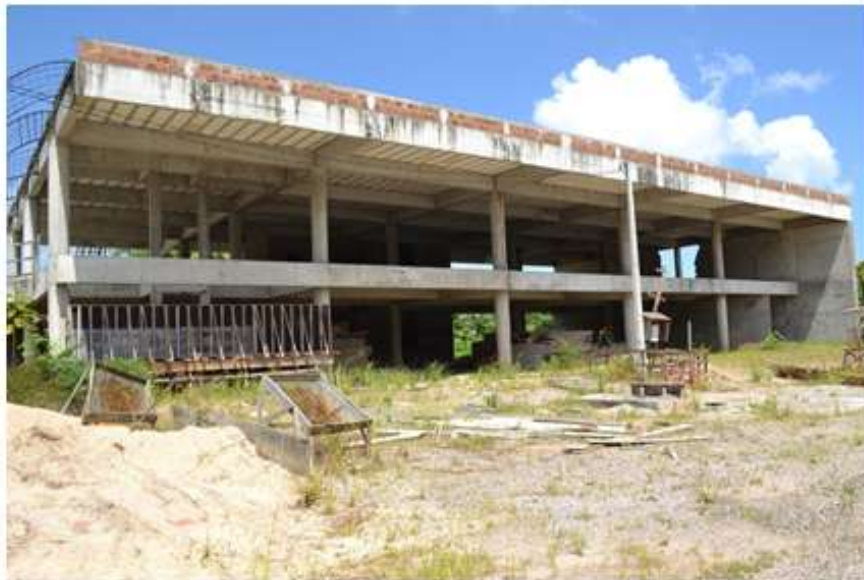
Biblioteca do CEGOE