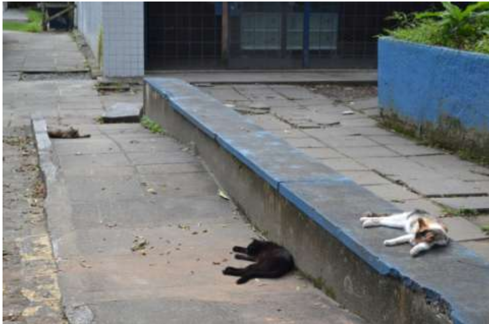
Gatos abandonados em frente ao RU/UFRPE