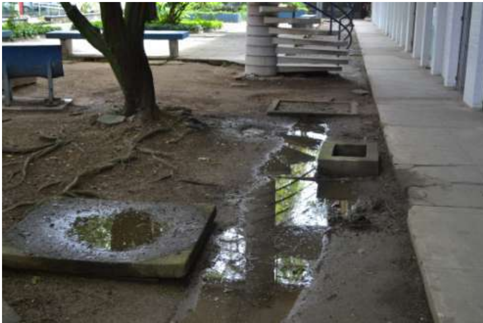
Caixa de gordura transbordando- próximo ao Prédio Central