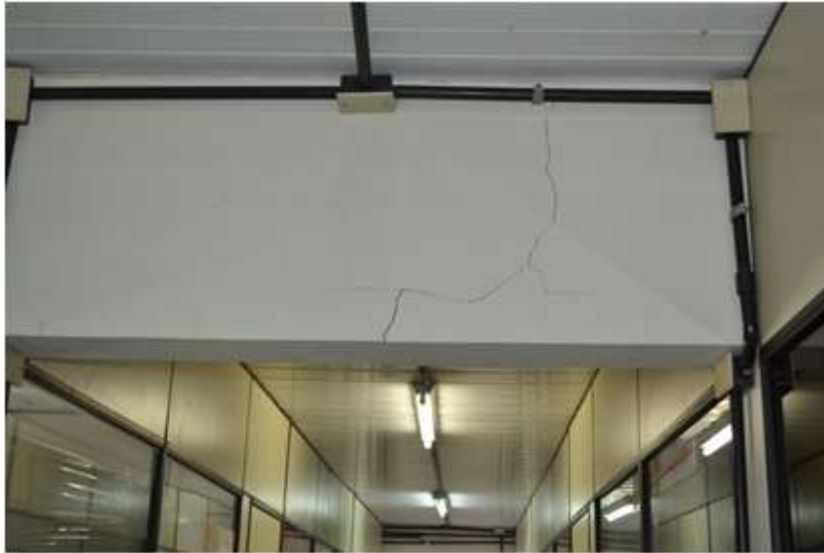
Gabinete de docentes lotados nos Departamentos de Letras e Ciências Humanas, Economia, Ciências Sociais, História e Administração