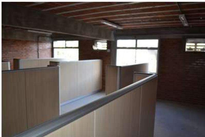
Gabinets de Docentes do Bloco D

O espaço para o trabalho docente de ensino, pesquisa e extensão exige condições mínimas de funcionamento. É fato que tais condições não são oferecidas para muitos/as docentes da UFRPE, seja por falta de estrutura de gabinetes, seja por falta de gabinetes para docentes. Sem dúvida, para o trabalho acadêmico, são necessários gabinetes com instalação elétrica adequada, ponto de internet em funcionamento, telefonia e, principalmente, acústica que favoreça o estudo do/a docente e a orientação de trabalhos.