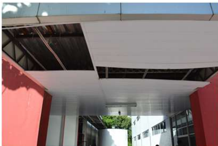
Ginásio - DEF